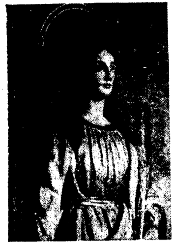
BELISIMA ESCULTURA DE SANTA BARBARA. OBRA DE LEON ORTEGA. QUE CON TANTA DEVOCION SE VENERA EN SILOS DE CALAÑAS

Hace tres años, el día 3 de diciembre de 1950, visitamos por primera vez Silos de Calañas. Acompañábamos al escultor Alfonso León Ortega que iba para la entrega a los